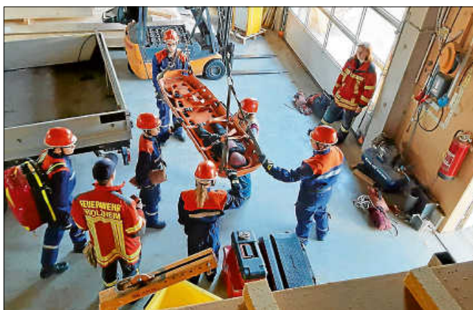
Rettung über Schleifkorbtrage