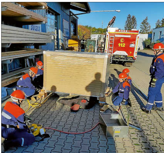
Anheben der Palette mit den Hebekissen

Mit den verschiedenen Übungen können wir unser Wissen im Bereich der Technischen Hilfeleistung immer weiter ausbauen.