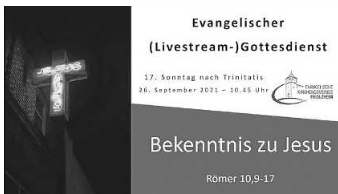
Plakat: C. Fritz / Unsplash

Folgendes muss aktuell bei der Feier eines Gottesdienstes beachtet werden: