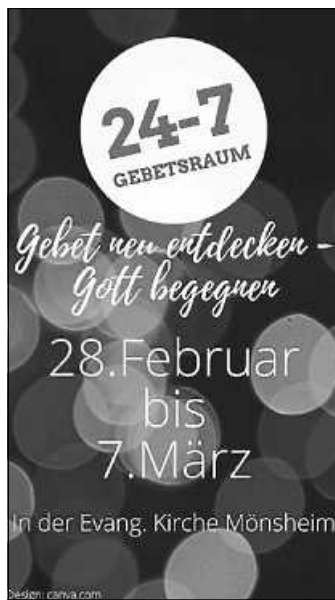
Plakat: D. Hirschmüller