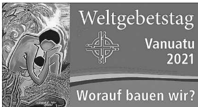
Plakat: WGT-Logo 2021

Über Länder- und Konfessionsgrenzen hinweg engagieren sich Frauen seit über 100 Jahren für den Weltgebetstag. Heute sind Frauen in über 150 Ländern und allen Regionen der Welt miteinander verbunden und machen sich stark für die Rechte von Frauen und Mädchen in Kirche und Gesellschaft. Mit den Spenden werden Projekte für Mädchen und Frauen in vielen Ländern der Erde unterstützt.