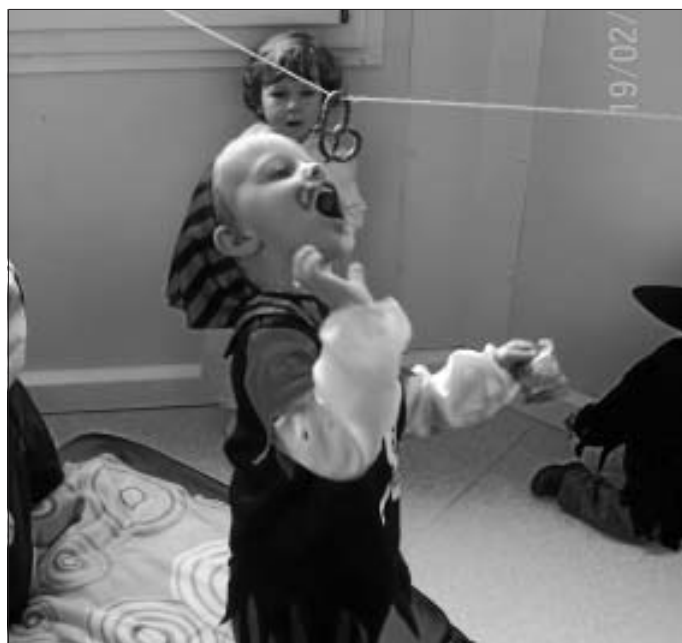
Die Kinder und Erzieherinnen der Krippe

Nachdem die Kinder verkleidet oder auch nicht da waren, konnten sich alle an den leckeren Buffets, welche unsere lieben Mamis mitgebracht hatten, stärken.