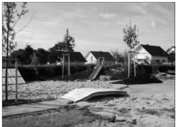
Der neu gestaltete Spielplatz an der Friolzheimer "Eiche"

Es grüßt herzlich, Ihre Gemeinde Friolzheim