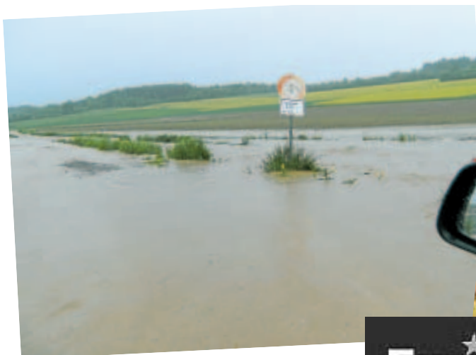
Land unter 15. Mai