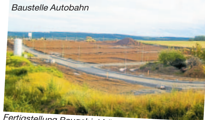
Fertigstellung Baugebiet Lüsse