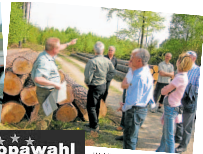
Waldbegang mit Forstamt

★ ★ ★ Europawahl ★ ★ ★ 2009 ★ ★ ★ Kommunalwahl ★ ★ ★