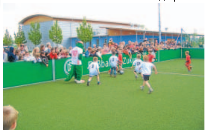
Einweihung Minispielfeld und Besuch Fritze