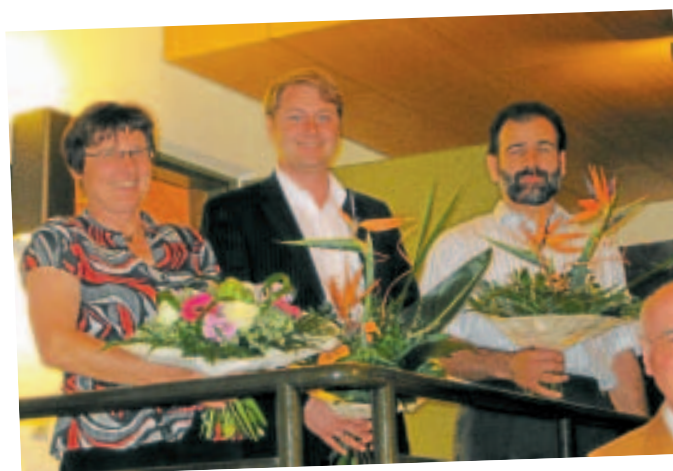
Neu gewählte Gemeinderäte