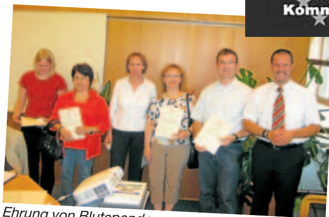
Ehrung von Blutspendern